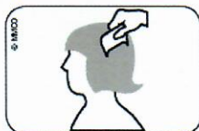
Abb. Durchkämmen des nassen Haares mit Läusekamm vom Haaransatz bis zu den Haarspitzen